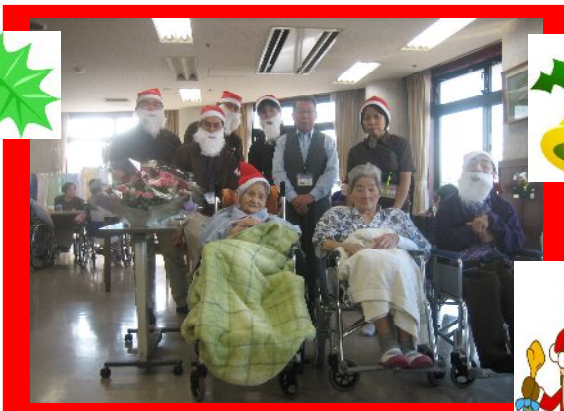
お気に入りの赤い三角帽